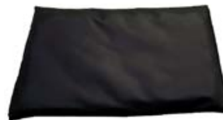
Polstring som helhet med gel inuti