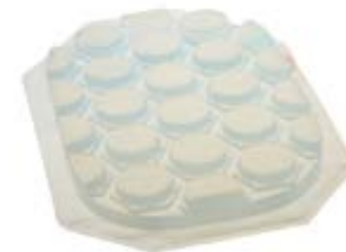
Gel som finns inuti överdraget